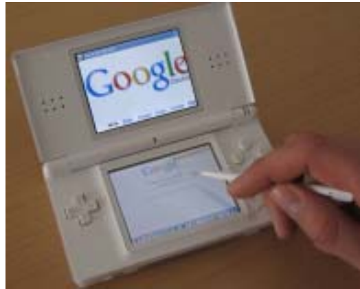
Surfen im WWW über den Nintendo DS

Für das vernetzte Spielen auf mobilen Spielekonsolen bestehen zwei Möglichkeiten: Per Funkverbindung direkt von Gerät zu Gerät oder per Internetverbindung zum Spielen im weltweiten Netz. Die direkte Funkverbindung ist räumlich sehr beschränkt. Kinder und Jugendliche können beispielsweise mit Freunden zuhause leicht den Kontakt zwischen den Spielekonsolen herstellen. Beim Nintendo DS kann man über diese Funkverbindung auch ohne Spiel nur über die Konsole mit Freunden in der Nähe (ca. zehn bis 30 Meter) kommunizieren: Das Chat-Programm PictoChat ist auf dem Gerät vorinstalliert. Ein erheblich erweiterter Kontaktraum lässt sich über eine Internetverbindung herstellen: So kann mit Spielerinnen und Spielern aus aller Welt gespielt werden. Nintendo hat hier für den DS eine Sicherheitslösung vorgesehen: Jede Spielerin bzw. jeder Spieler erhält im jeweiligen Spiel einen sogenannten Freundescode. In der Regel können die Spieler erst nach dem Austausch dieses Codes eine Verbindung aufbauen und miteinander spielen. Theoretisch können so nur Spielerinnen und Spieler, die sich bereits kennen (z. B. Schulfreunde), diesen Code austauschen. Im Internet haben sich jedoch Foren etabliert, in