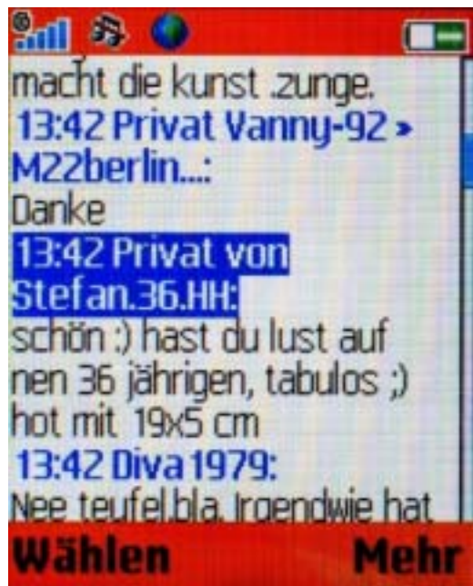
Belästigung in mobilen Chats: Privatnachricht an die vermeintlich 14-Jährige „Vanny-92“

Das Chatten ist bei Kindern und Jugendlichen sehr beliebt und inzwischen auch über das Handy möglich. Große WAP-Portale bieten dazu Chat-Räume an, es gibt auch bereits spezielle Instant Messenger wie ICQ oder MSN für mobile Geräte. Unsere Recherchen in mobilen Chats haben gezeigt, dass dort ähnliche Jugendschutzprobleme auftreten wie in Internet-Chats. Es kommt regelmäßig zu sexuellen Belästigungen insbesondere von Mädchen (etwa durch Fragen nach dem Aussehen, nach sexuellen Praktiken oder nach Telefonsex). Weiterhin zeigen Erfahrungen aus den Internet-Chats, dass Erwachsene auch versuchen, mit Gesprächen über harmlose Dialoge das Vertrauen von Kindern zu gewinnen („Grooming“), um sie zu realen Treffen zu bewegen. Ein sexueller Missbrauch kann die schlimme Folge sein (vgl. dazu ausführlich www.chatten-ohne